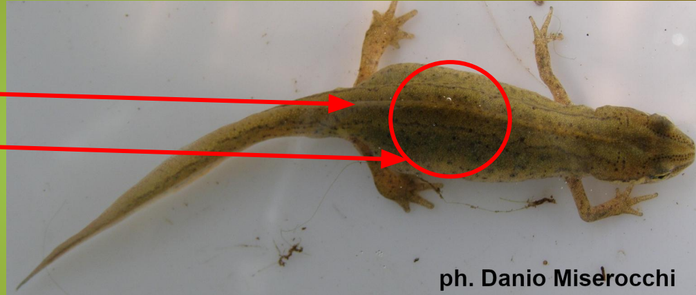
ph. Danio Miseroocchi

Difficili da distinguere a meno che non sia solo parzialmente schiacciata e si guarda sempre la presenza/assenza della "crestina" e se c'è la macchia nera delle uova schiacciate